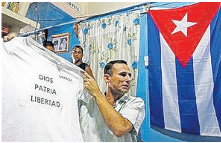
HAVANA (AP) – Cuba ayera a acusa un di e diplomaticonan halto di Estadonan Uni staciona na e isla cu e lo ta traha estrechamente cu Jose Dainel

Ferrer, e lider deteni di un di e gruponan di oposicion mas importante di e pais.